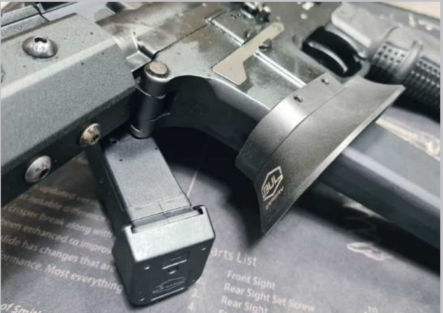
Optional minigonna maggiorata in alluminio.