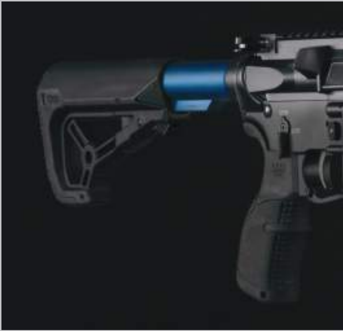
Il calcio a sei posizioni Magpul include una piastra per imbracciatura ambidestra.