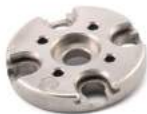
Shell plate Square Deal. Specificare il calibro