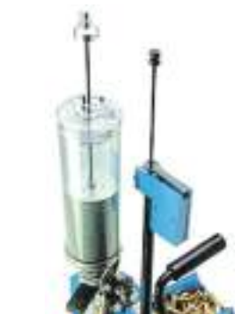
Sistema controllo polvere nel dosatore.