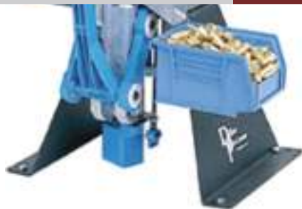
Base dillon per square deal.