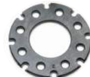
SHELL PLATE 1050. Shell plate di ricambio per RL650. Specificare il calibro.