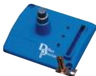
Base porta conversione, per RL53 / 650 / xl750.