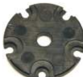
SHELL PLATE 650/750. Shell plate di ricambio per XL650/750. Specificare il calibro.