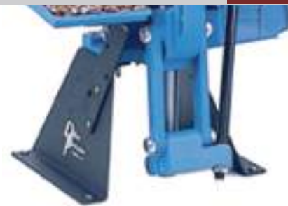
Base dillon per 550.