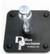
Base porta conversione per super 1050