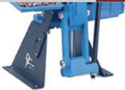
Base dillon per xl750.