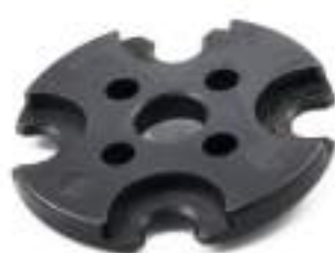
Shell plate RL550. Specificare il calibro