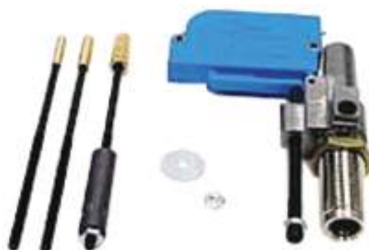
Dies controllo polvere, per xl650-1050.