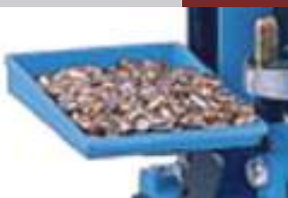
Piatto porta palle, per presse Square Deal/550/650/1050.