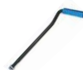
Leva di ricambio con manopola colorata in alluminio.