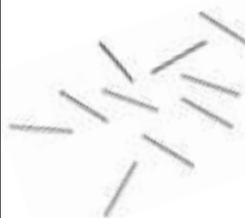
Redding small decapping pins Art. RD.01059 Redding large decapping pins Art. RD.01060