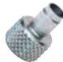
Boccola in acciaio per art. RD26400.