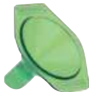
Imbuto per polvere.