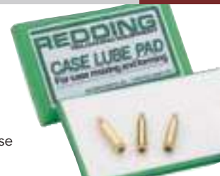
Tampone case lube