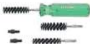
Tre spazzolini dal .22 al .45 per la pulizia del bossolo, e 2 fresette per la pulizia della sede dell'innesco.