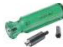
Uniformatore per la sede dell'innesco con drill adattatore. Art. RD.09100, Large. - Art. RD.09105, Small.