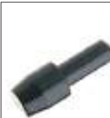
Art. 15xxx Il 3/8" shank pilot può essere utilizzato anche con i tornietti della Hornady o della Forster. € 6,00