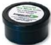
Lubrificante asciutto per l'interno e l'esterno del colletto.