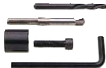
Kit per la rimozione del bossolo nel caso si dovesse incastrare involontariamente un bossolo poco lubrificato all'interno del dies.