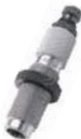
Special small base type-full dies