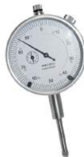
Redding dial indicator 0,001"