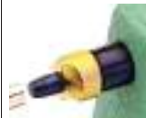
Art. RD14050 Tagliante ad alta velocità in nitruro di titanio. € 31,00