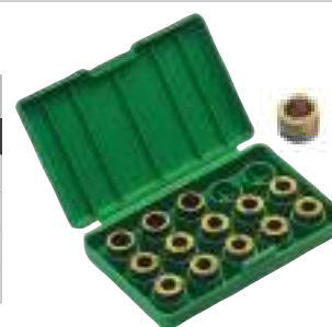
Bushing in titanio per la ricalibratura del colletto.