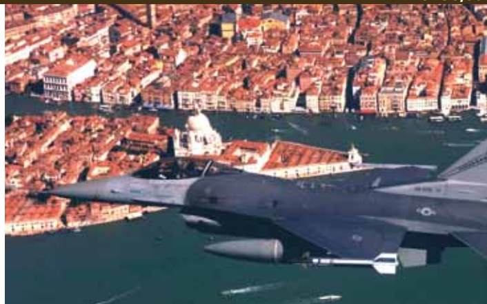
Art. F16 ACCIAIO

Resiste ad alto numero di G. positivi e negativi.