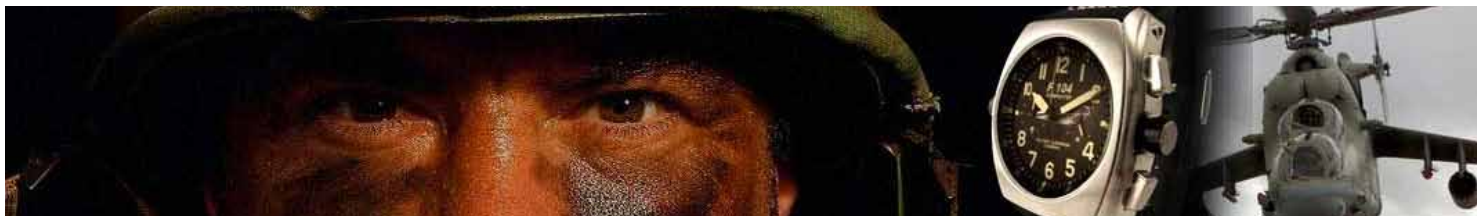
Art. F16 BLACK